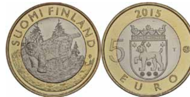
2015 ist eine Sonderedition der 5 Euro Gedenkmünze herausgekommen (Abb.7). Die Serie wird seit 2014 geprägt. Die Vorderseite des Sammlerstücks zeigt den Luchs, während auf der Rückseite das historische Wappen von Tavastia zu sehen ist. Die Münze gehört zu der beeindruckenden Serie „Tierwelt Finnlands“, welche die bedeutendsten Tiere der historischen Provinzen ehrt. Der Luchs, dessen Markenzeichen das gepunktete Fell und die markanten Ohren sind, ist das emblematische Tier Tavastias.

In grafisch ornamentalischen Darstellungen ausgeführt als Fresko oder Sgraffito 5 zeigt sich der Luchs als Sinnbild. Die gestalteten Hausfassaden in Graubünden z.B. sind der Emblemik 6 zuzuordnen. Der Ursprung des Emblems geht auf eine Kunstform aus der Renaissance zurück und die drei Teile Bild, Motto, Bedeutung bezogen sich aufeinander. Für Auftraggeber und Künstler bestand ganz selbstverständlich eine Einheit von Bild und Wort d.h. das Bild galt - in der Dichtungstheorie z.B in Frankreich und Italien - als Gedicht, als Poesia in der Malerei. Das gilt auch für Fassaden, die der Öffentlichkeit die Nähe zur Dichtkunst demonstrieren sollten. 7 In Buchform veröffentlicht, waren Bilder und Texte auf besondere Weise miteinander verbunden - die drei Teile eines Emblems bezogen sich aufeinander und ermöglichten es, den verborgenen Sinn hinter dem oft rätselhaften ersten Eindruck zu erkennen. Im vollumfänglichen philosophisch-wissenschaftlichen Werk „Emblemata“ gibt es lediglich zwei Darstellungen des Tieres. Als „Lernbilder der Natur“ wurde der Luchs oft mythologisch beschrieben und illustriert.