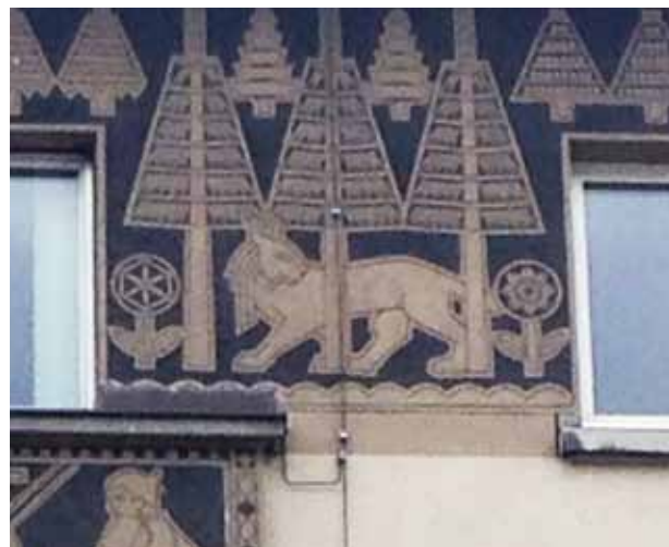
An der Hausfassade der alten Post in Davos Platz wurde ein sinnbildliches „Sgraffito“ vom Luchs gesichtet und dokumentiert (Abb.5).