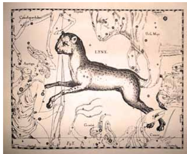
Die „Lynx Constellation“ (Abb.6) ist ein unscheinbares Sternbild des Nordhimmels und besteht aus einer Kette von vier lichtschwachen Sternen. Zu seiner Bestimmung führte die grafische „Tavola Astronomia Firmamentum“ von Johannes Hevelius, pubblicato nel 1690.